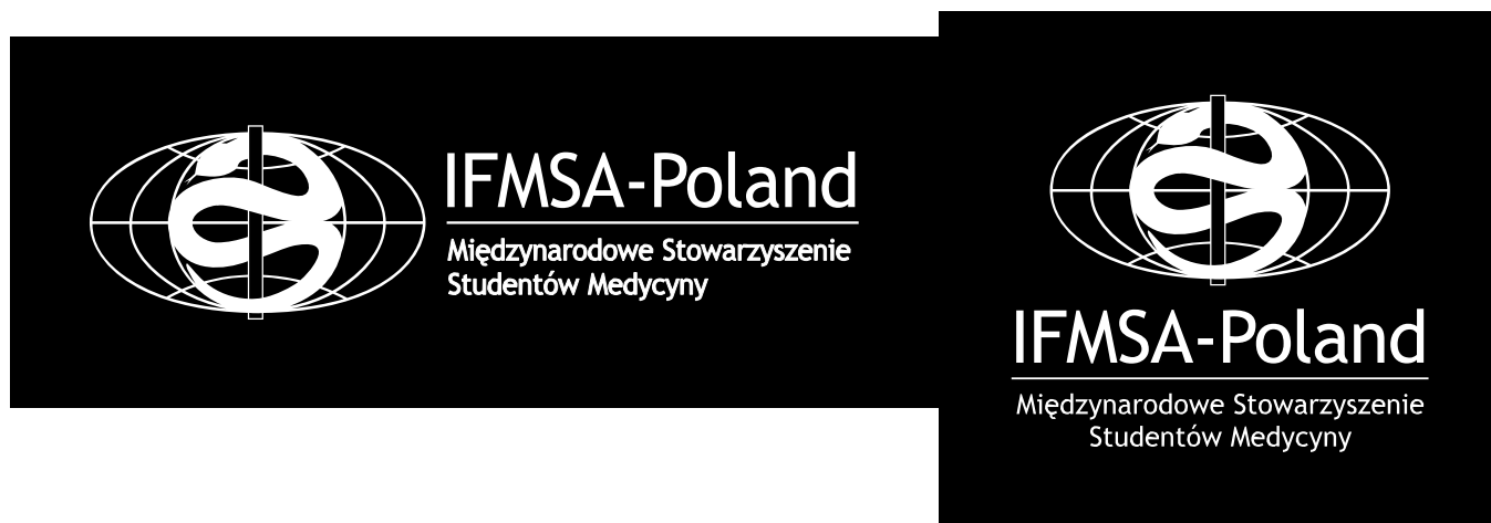
Ryc. 4. Biała wersja logo

3.2.2.2. Wobec logo IFMSA-Poland nie stosuje się zmian poziomu krycia jak również zmian jego wypełnienia.