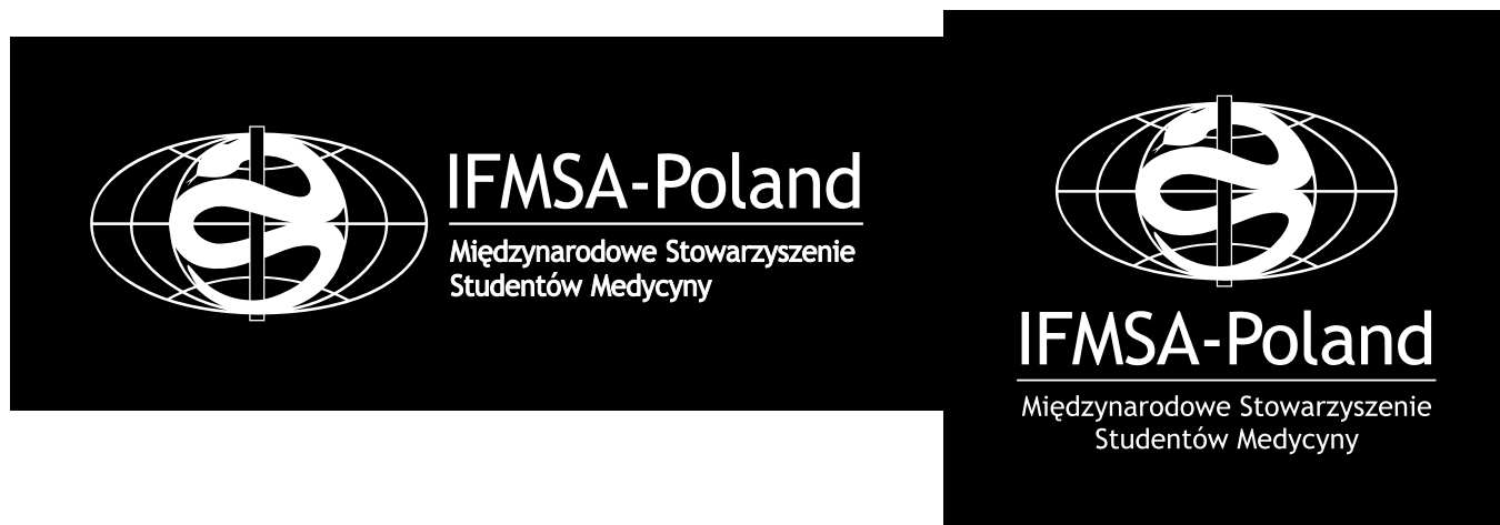
Ryc. 4. Biała wersja logo

Wobec logo IFMSA-Poland nie stosuje się zmian poziomu krycia jak również zmian jego wypełnienia.