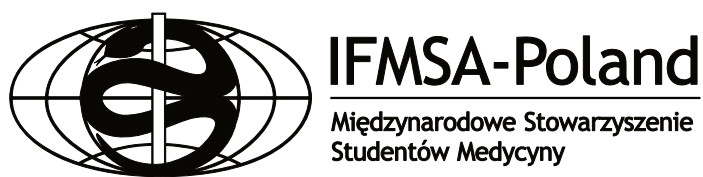
Ryc. 3. Czarna wersja logo